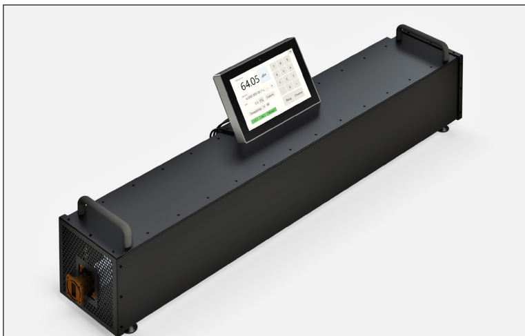
Фото измерителя WPM-5000